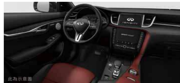
深緋紅 (旗艦款，接單生產)