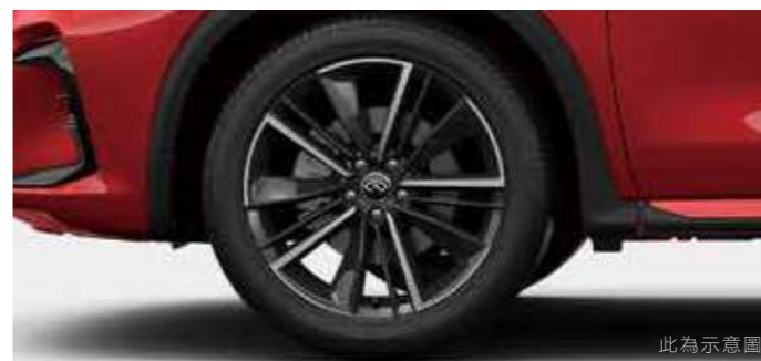
20 吋劍影鋁合金輪圈