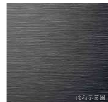
霧黑楓木紋飾板 (旗艦款)