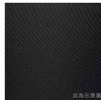
鋁合金飾板 (風尚款)