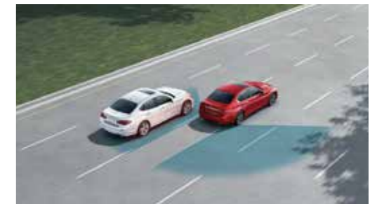
BSI 盲點側撞預防系統

車速於 70km/h 以上時啟動，偵測到車輛非刻意偏移車道時，將即時警示並主動啟動單側煞車協助導正行車方向。