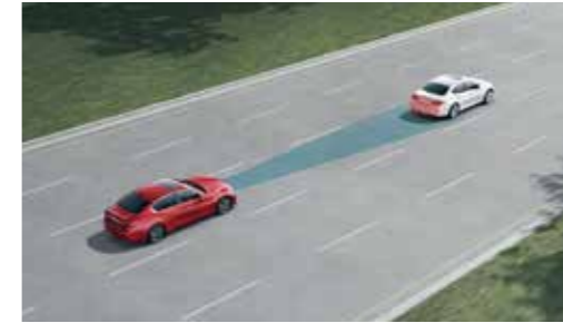
ICC 全速域智慧定速系統

當車速介於 0-144km/h 時，可依你的偏好設定三段安全車距，並根據前車的速度變化自動加速、減速，達到自動跟車的效果，並同時監控是否與前車保持足夠的安全距離，若與前車距離過近，將自動減速，預防煞車不及的狀況發生。