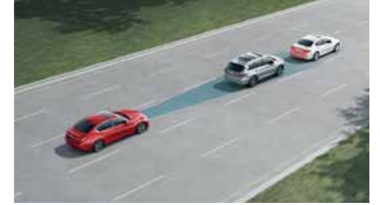
PFCW 超視距車輛追撞警示系統 PFEB 自動急停輔助系統附行人偵測

當車速介於 0-144km/h 時，可依你的偏好設定三段安全車距，並根據前車的速度變化自動加速、減速，達到自動跟車的效果，並同時監控是否與前車保持足夠的安全距離，若與前車距離過近，將自動減速，預防煞車不及的狀況發生。