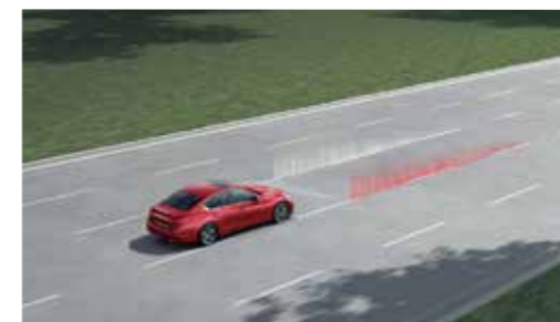
LDP 車道偏移預防系統

能同時監控前車與前前車，當預測到前車與前前車有追撞可能，將立即警示駕駛，為駕駛爭取更多反應時間；當有可能與前車或行人發生碰撞意外時，將主動煞車，使碰撞發生機率降低。