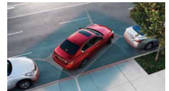
AVM 環景顯示附 MOD 物體偵測

可於倒車時主動偵測後方靜止或移動物體，消除視覺死角，於後方左右兩側偵測到物體時，將發出警示音提醒駕駛，於正後方預測到碰撞危險時，將主動緊急煞車，降低發生碰撞的風險。