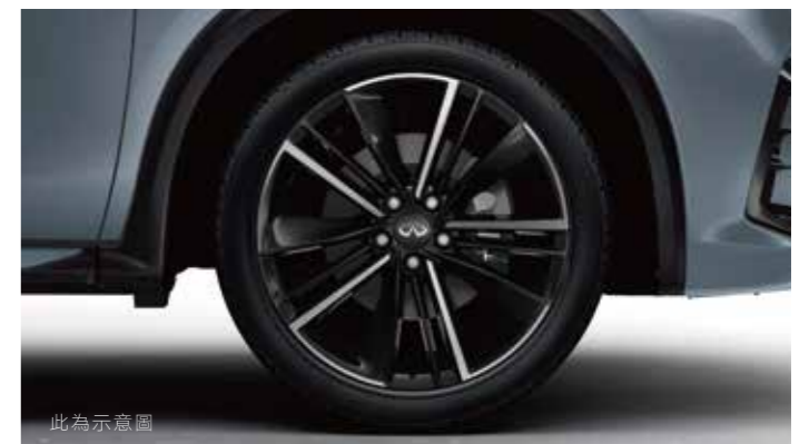
19吋鋁合金輪圈 (豪華/風尚款)