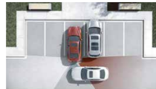
RAEB 倒車急停輔助系統 RCTA 後方側向車流警示系統

透過後保桿內兩側的遠距感應雷達偵測後方來車，若雷達感知器偵測到偵測區域中有車輛，車側指示燈會自動點亮警示；若此時駕駛欲變換車道，啟動方向燈，車側指示燈會閃爍、發出警示音並主動啟動單側煞車，協助導正行車方向。